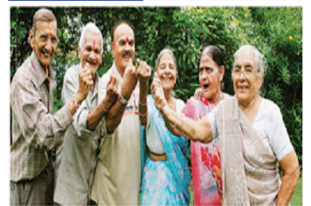
Atal Vayo Abhyuday Yojana 2023

(A) अटल वयो अभ्युदय योजना भारत में वरिष्ठ नागरिकों सशक्त बनाने के उद्देश्य से एक व्यापक पहल है। इसे सामाजिक न्याय और अधिकारिता मंत्रालय द्वारा पेश किया गया था। यह योजना बुजुर्गों द्वारा समाज में किए गए अमूल्य योगदान को मान्यता देती है और उनकी भलाई एवं सामाजिक समावेश सुनिश्चित करना चाहती है।