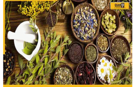
INDIA TO HOST ASEAN COUNTRIES CONFERENCE ON TRADITIONAL MEDICINES

(B) भारत 20 जुलाई 2023 को पारंपरिक दवाओं पर आसियान देशों के सम्मेलन की मेजबानी करेगा। यह सम्मेलन लगभग एक दशक के बाद नई दिल्ली में आयोजित किया जाएगा। सम्मेलन में कंबोडिया और वियतनाम समेत दस आसियान देश हिस्सा लेंगे। इसकी मेजबानी विदेश मंत्रालय, आसियान में भारतीय मिशन और आसियान सचिवालय के सहयोग से आयुष मंत्रालय द्वारा की जाएगी।